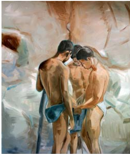
Untitled, oil on canvas, 130x150, 2011